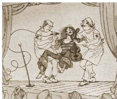
„Bitlo“ perauklėjimas - karikatūra iš tuomečio humoro žurnalo „Šluota“