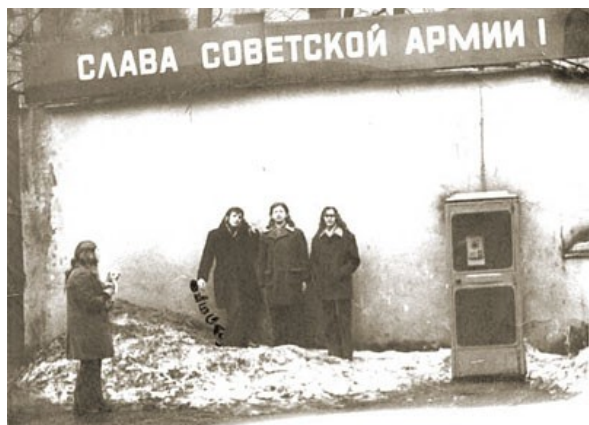
Bytnikai roko muzikantai tranzuoja (7-tas dešimtmetis, KGB medžiaga)

Džeko Keruako „Kelyje“ buvo kultinė jaunosios kartos knyga, o joje kaip tik ir buvo propaguojamas „tranzuojančio“, laisvo, nesuvaržyto, neprisirišusio prie vietų ir daiktų, žmogaus įvaizdis. „Tranzavimas“ tapo vos ne profesionaliu sportu, ypač šiltuoju metų laiku. Pagrindiniai kelionių centrai – pravažiuojant Rygą, nuvykti iki Talino (šis miestas Sovietų Sąjungoje buvo savotiška Meka) bytnikams buvo „garbės reikalas“, taip pat Krymas, Leningradas, Maskva. Dažnas buvo „išmaišęs“ visą Sovietų Sąjungą. Į Estiją važiuodavo dėl to, kad čia buvo žymiai liberalesnis gyvenimas. Muzika mus versdavo tranzuoti, nes tai irgi buvo principas. Vasara buvo patogiausias metų laikas, šiuo metu laiku daug muzikantų plūsdavo į Lietuvos pajūrį (Palanga, Kuršių Nerija). Palangos „akmenys“ (tvoros dalis centrinėje miesto dalyje) buvo visų bytnikų susitikimo „taškas“. Visoje plačioje Sovietų Sąjungoje roko muzikantai dažnai jausdavosi kaip namuose, nes visuomet atsirasdavo tų, kurie savo namuose apnakvindindavo, valgydindavo, dalinosi rūbais ir muzikos plokštelėmis.