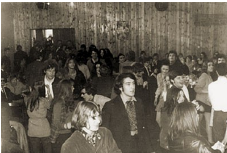
Nesankcionuotas roko muzikos koncertas